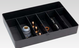
Kulutustarvikelaatikko Torch TPT 40:lle 45 A-039957