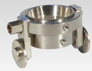
Käräry Torch TPT 40:lle 040199