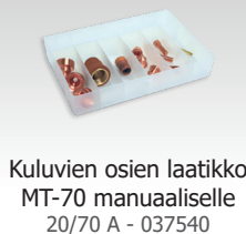
Kuluvien osien laatikko MT-70 manuaaliselle 20/70 A - 037540