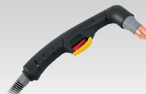
Poltin MT-70 manuaalinen 70 A (50%) 6 m - 037502 12 m - 037519